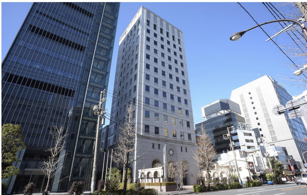
2022年 日本地図学会 定期大会 都内地図・図書展会場 日本大学経済学部7号館